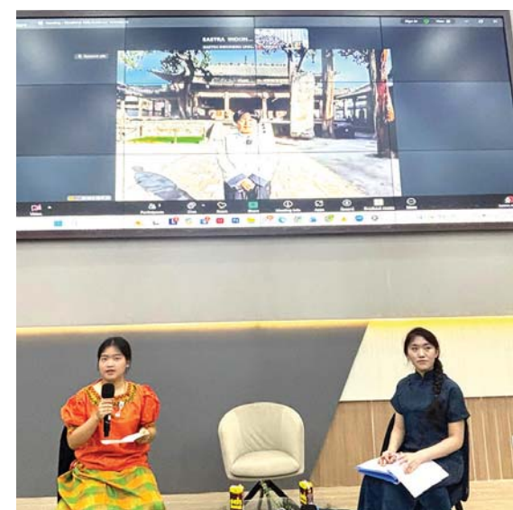
Jelajahi Budaya Tiongkok

Bustanul sendiri mengaku tidak mengetahui perihal PT Almira sebagai penyedia bibit nanas tahun 2024. Ia menghormati proses hukum yang berlaku. "Artinya kita hormati proses hukum, dan kita pasti proaktif kalau ada hal-hal yang dibutuhkan," tandasnya. (uca-edo/ham)