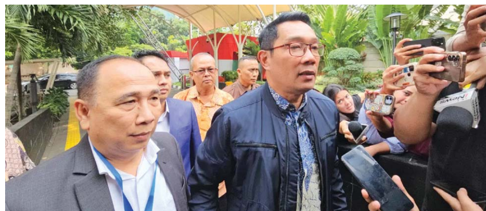
DIPERIKSA. Mantan Gubernur Jabar, Ridwan Kamil memenuhi panggilan KPK, Selasa, 2 Desember 2025. Ia hadir sebagai saksi terkait penyidikan dugaan korupsi pengadaan iklan pada BJB.

Menurut RK, selama menjabat sebagai Gubernur Jabar, ia tidak pernah menerima laporan terkait aksi korporasi yang kini diusut KPK tersebut. "Sayatidak terlibat," ucapnya.