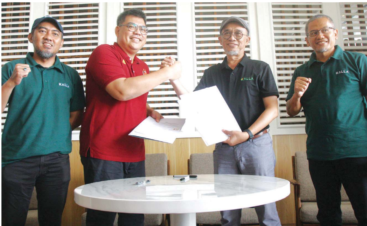
LAYANI PP. Cahaya Bone akan melayani suporter dari Makassar setiap PSM bermain di Parepare. Harga tiket bus di luar tiket stadion, Rp240 ribu PP.

Program ini juga dibarengi layanan bundling tiket pertandingan di semua kelas, dengan target khusus laga melawan Persebaya mencapai