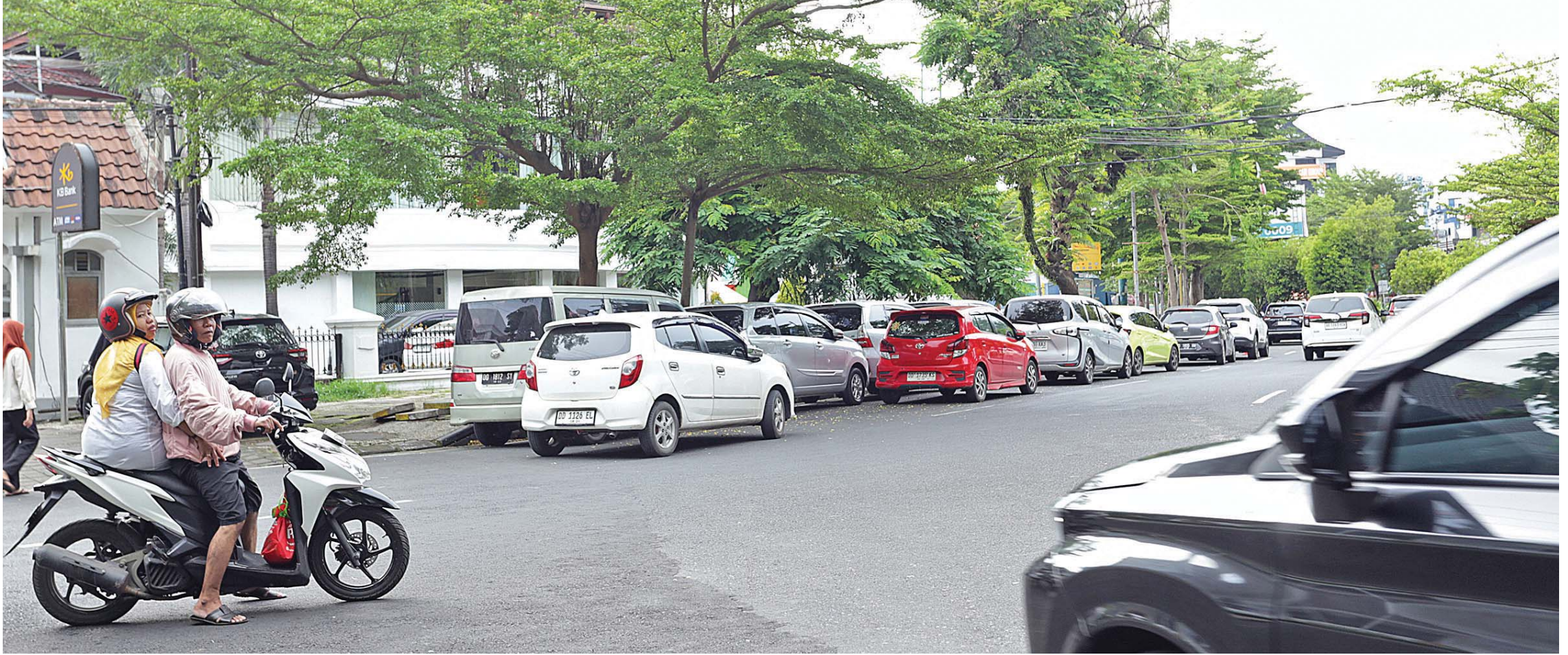
DUA JALUR. Deretan kendaraan terparkir di badan Jalan Slamet Riadi, tepat di sisi kiri samping Kantor Balai Kota Makassar. Mobil-mobil tidak hanya memenuhi bahu jalan, tetapi juga melebar hingga ke jalur utama, sehingga menyempitkan ruang gerak pengendara.