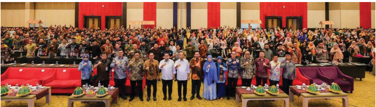
PEDULI GURU. Gubernur Sulsel, Andi Sudirman Sulaiman hadir Peringatan HGN Tahun 2025 yang digelar di Hotel Dalton Makassar, Selasa, 2 Desember 2025.

guru hebat, kita akan melahirkan generasi Sulsel yang cerdas, berkarakter, dan menjunjung tinggi prinsip sipakatau, sipakainge, dan sipakalebbi yang menjadi karakter masyarakat Sulsel," tuturnya. (*/iad)